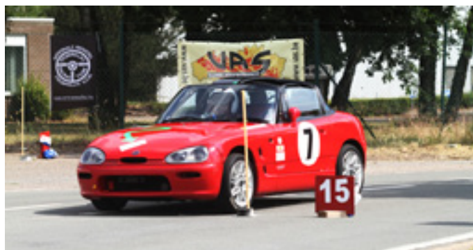
Suffeleers Jelrik Suzuki Cappuccino