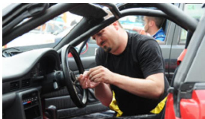
Steeds maar sleutelen en bijstellen ...