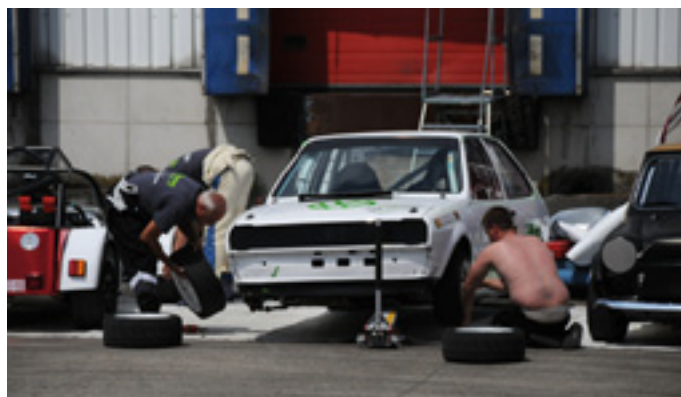
Vier handen zijn vlugger dan twee ...

Persbericht zonder reglementaire waarde. Uitslagen ten informatieve titel. De officiële uitslag verschijnt op www.vas.be