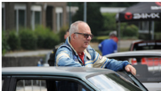
Benieuwd hoe de concurrentie het doet ...